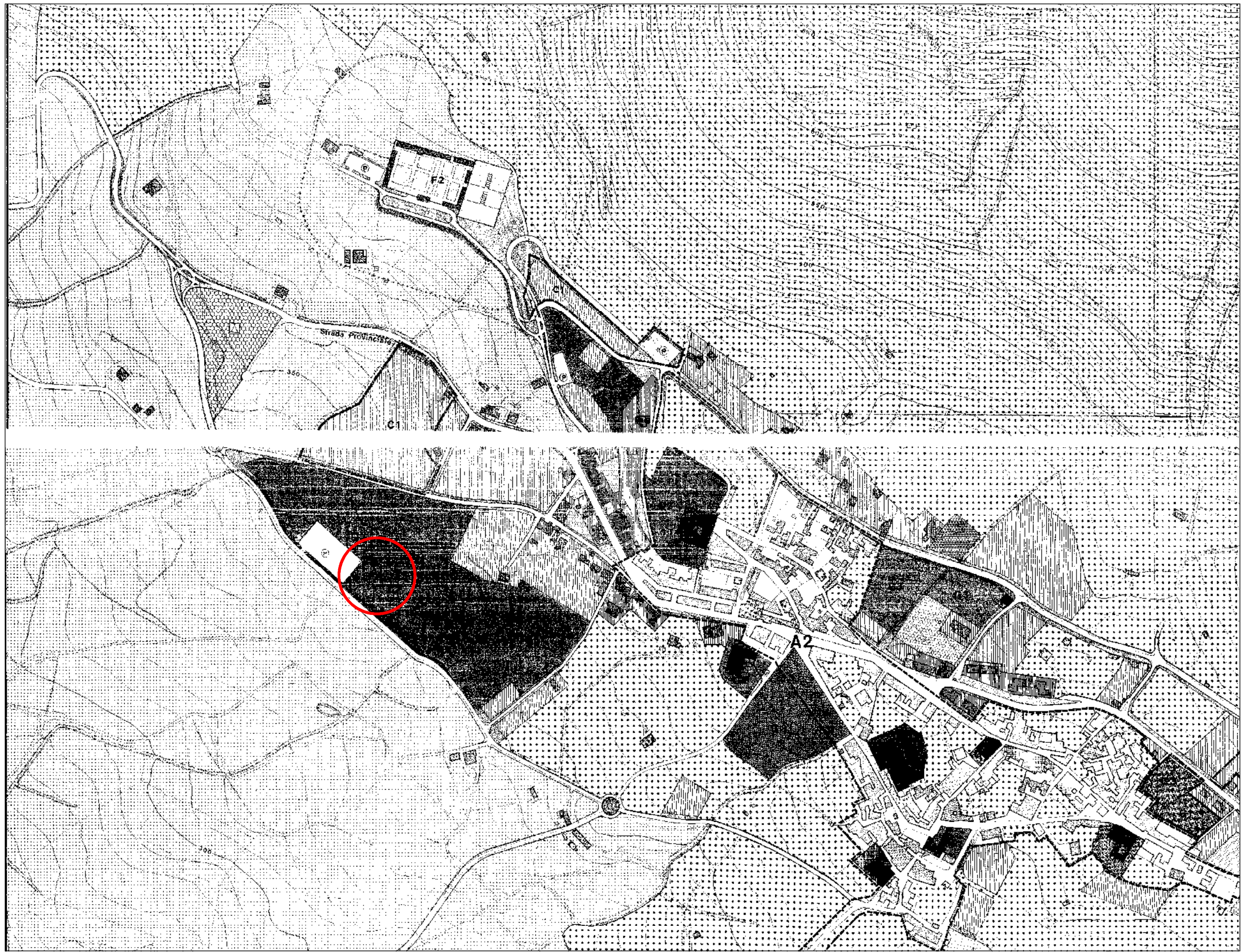
PIANO REGOLATORE GENERALE